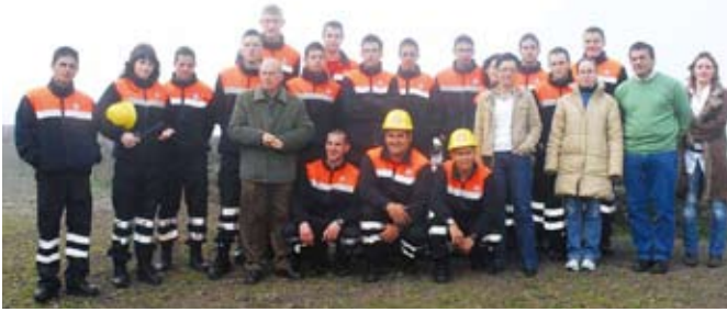
Alumnos y profesores posan con los cargos del Cabildo